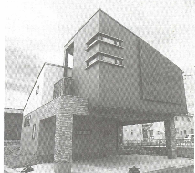
3台分の駐車場を確保した個性的なデザインでも、ウォールスタットで耐震性を担保